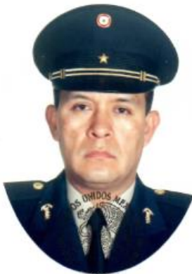
SECRETARIA DE LA DEFENSA NACIONAL Dirección General de Educación Militar y Rectoría de la U.D.E.F.A. DIRECCION

Dado en la Plaza de México, Distrito Federal, el día 1/o. del mes de septiembre del 2002.